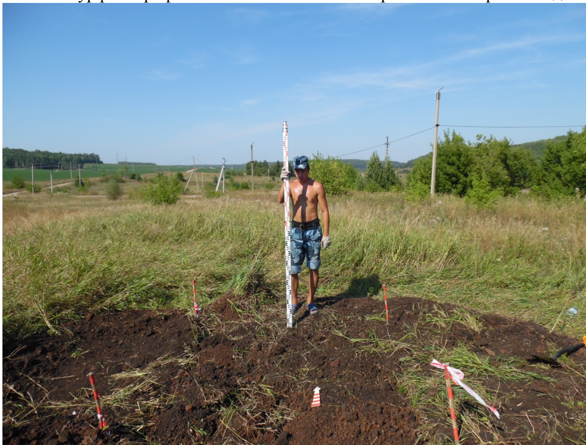
Рис.14. Шурф 2 после планирования.