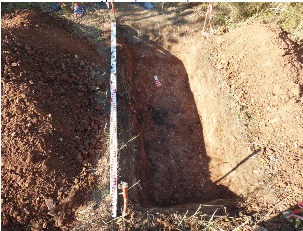
Рис. 16. Шурф 3. Общий вид. Вид с Ю.