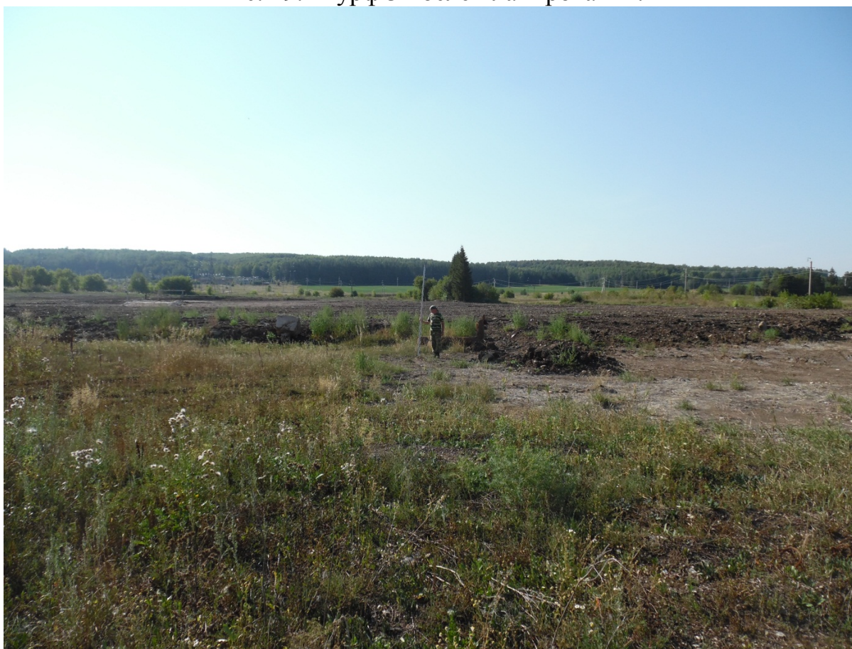
Рис. 20. Территория участка вид с В.