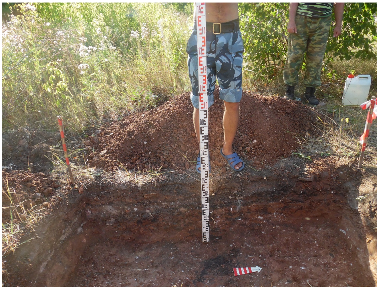
Рис. 17. Шурф 3. Профиль западной стенки. Вид с В.