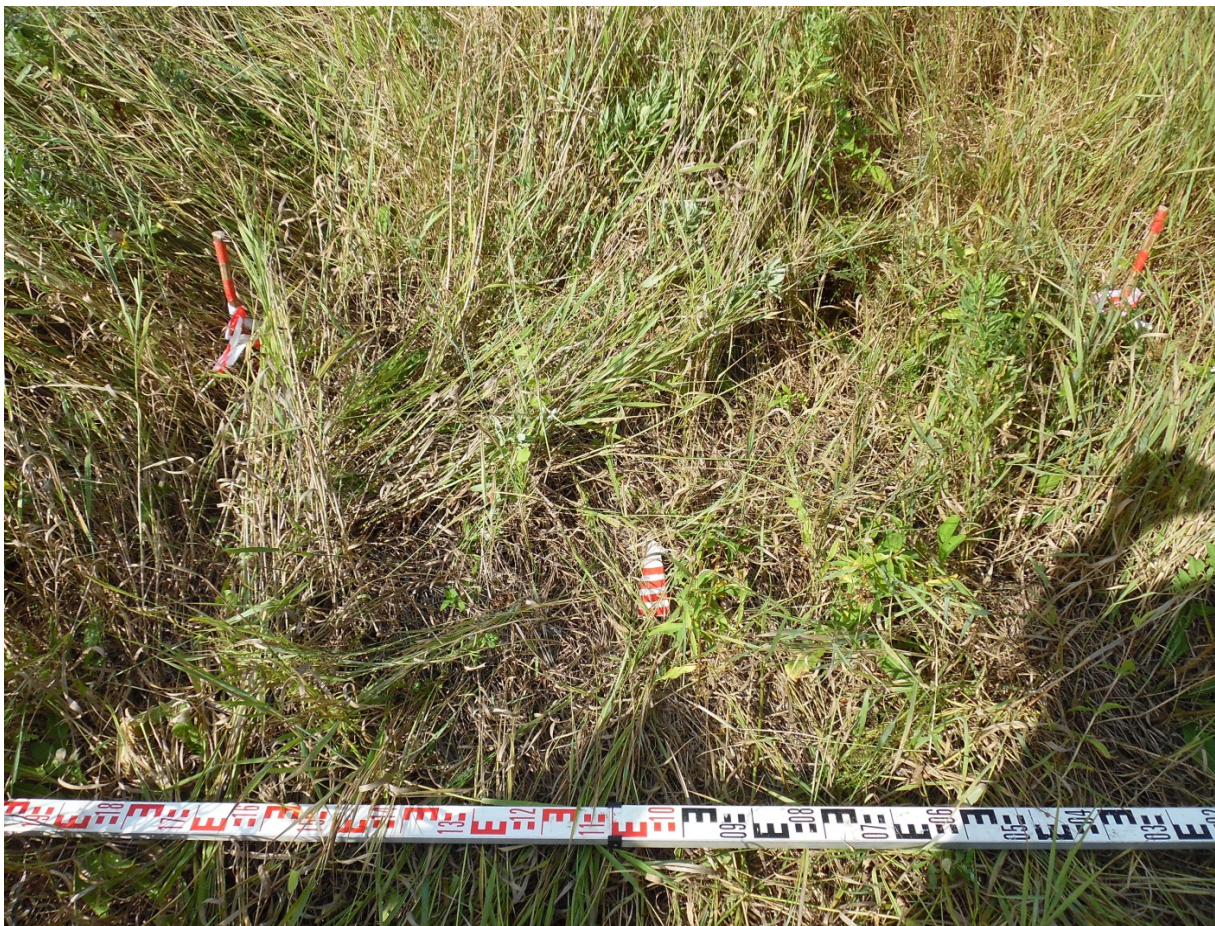
Рис. 5. Шурф 1 перед началом работ. Вид с Ю.