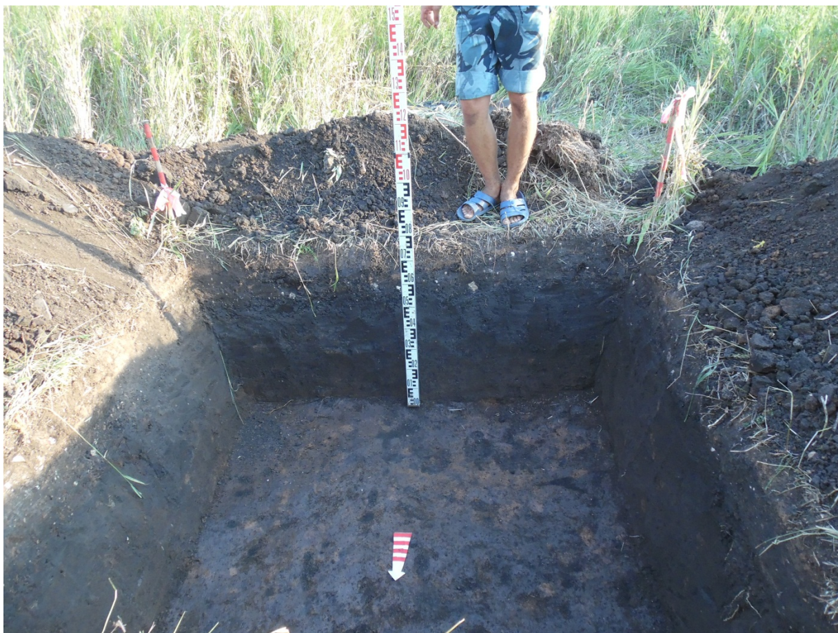
Рис.7. Шурф 1. Профиль южной стенки. Вид с С.