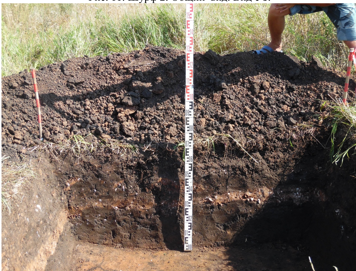
Рис. 12. Шурф 2. Профиль восточной стенки. Вид с 3.