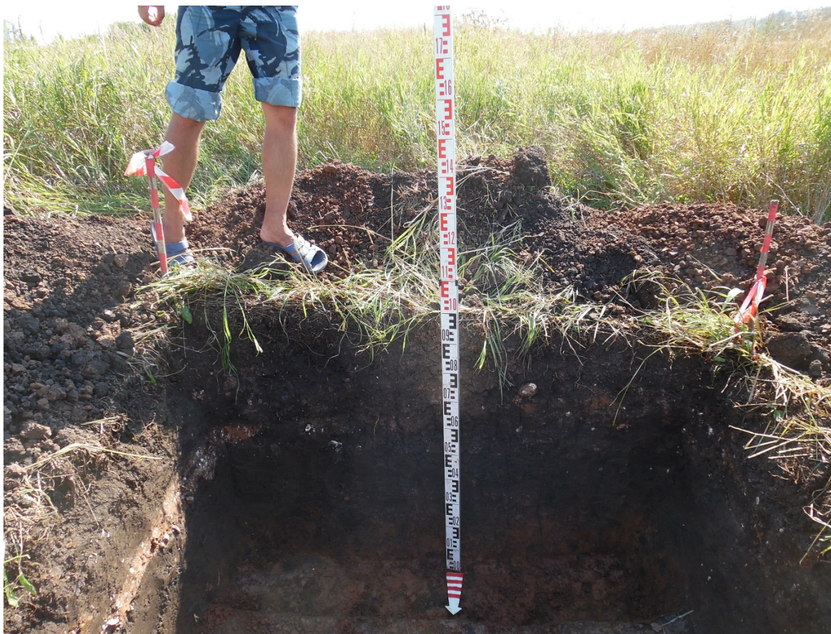
Рис. 13. Шурф 2. Профиль южной стенки после прокопки материка. Вид с С.