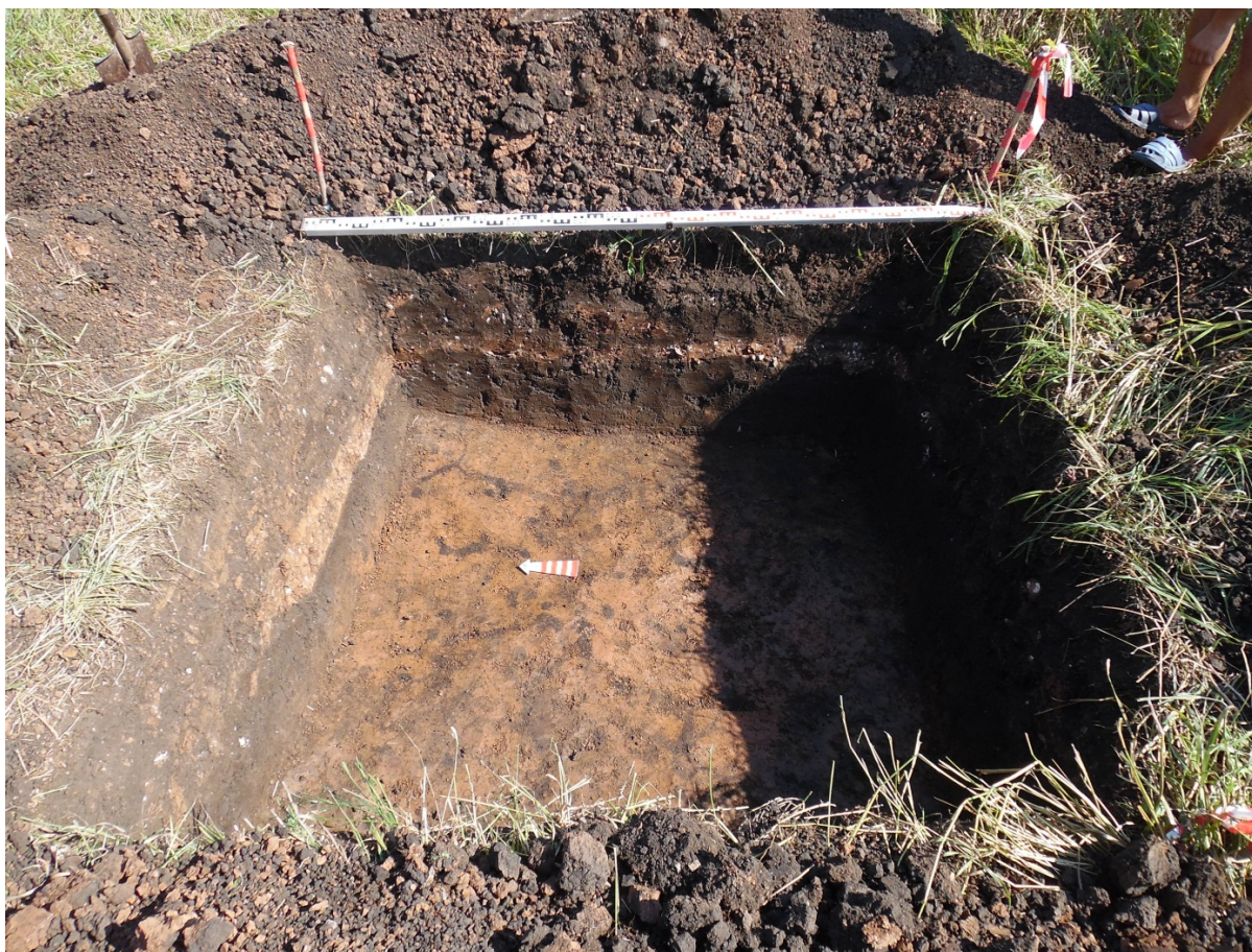
Рис. 11. Шурф 2. Общий вид. Вид с 3.