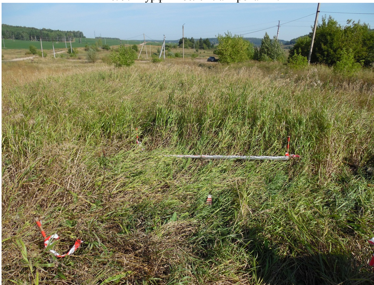
Рис. 10. Шурф 2 перед началом работ. Вид с Ю.