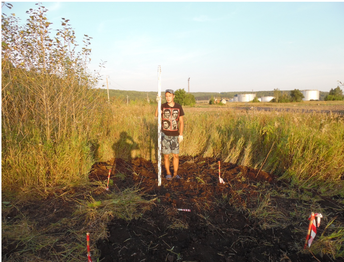
Рис. 9. Шурф 1 после планирования.