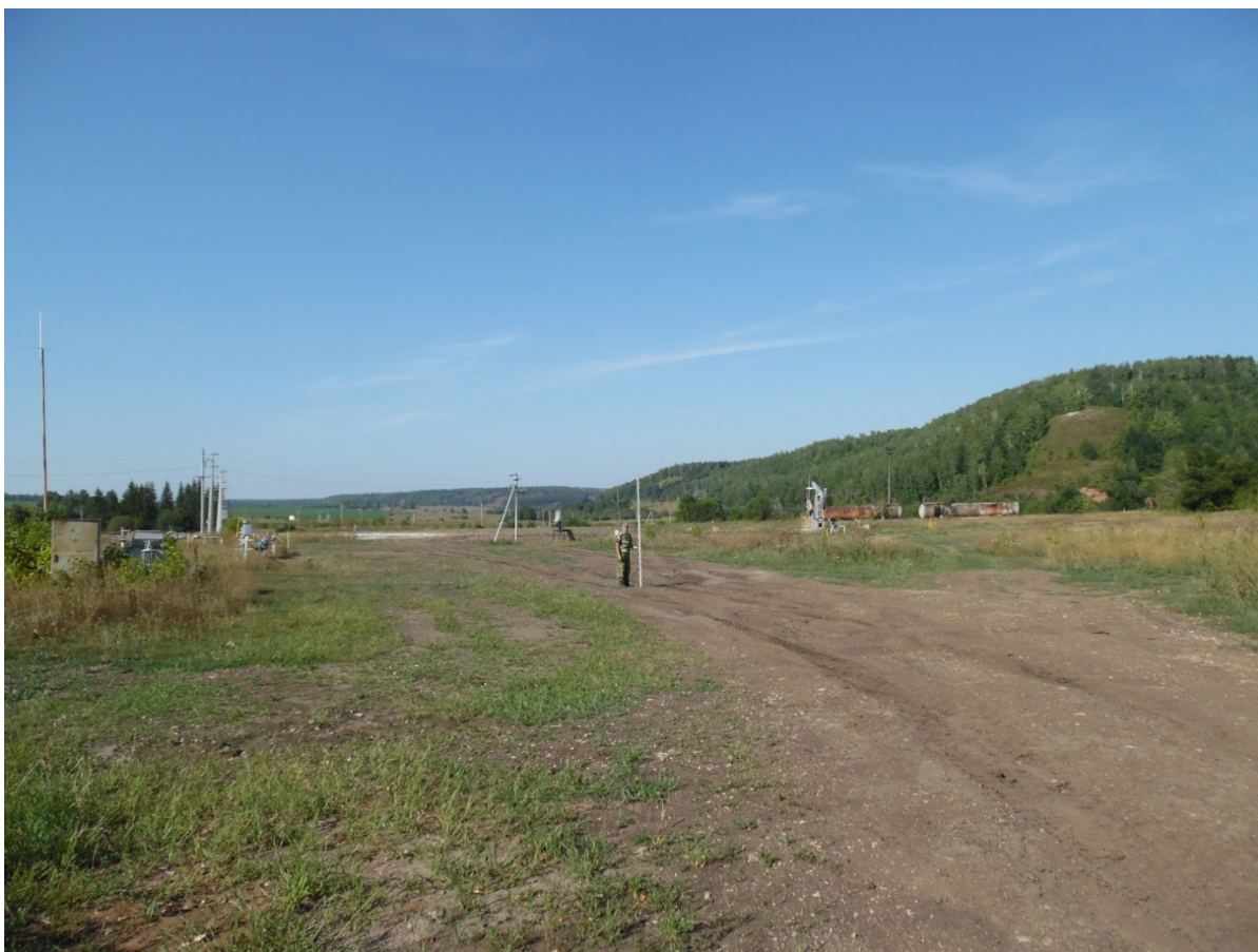
Рис. 3. Пересечение участка с грунтовой дороги вид с Ю.