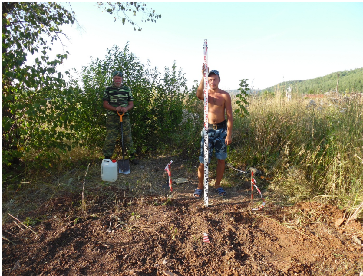
Рис. 19. Шурф 3 после планирования.