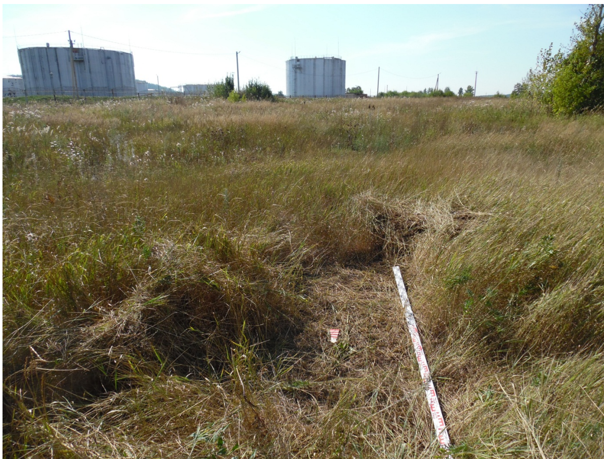
Рис. 15. Шурф 3 перед началом работ. Вид с С.